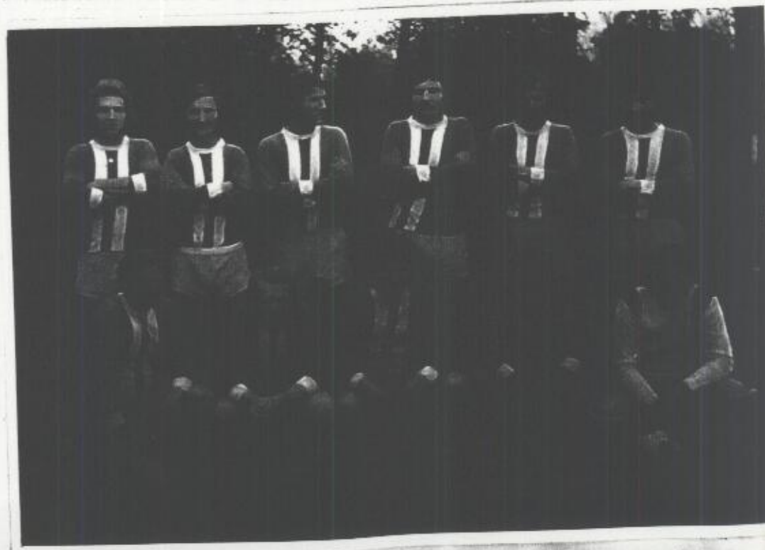
NAŠE MUŽSTVA PŘED UTKANÍM S TEPLÁRNOU